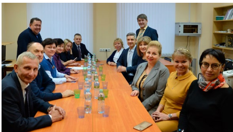
Предварительное заседание жюри и наблюдателей. Инструктаж по технологии конкурсных процедур, заполнению чек-листов