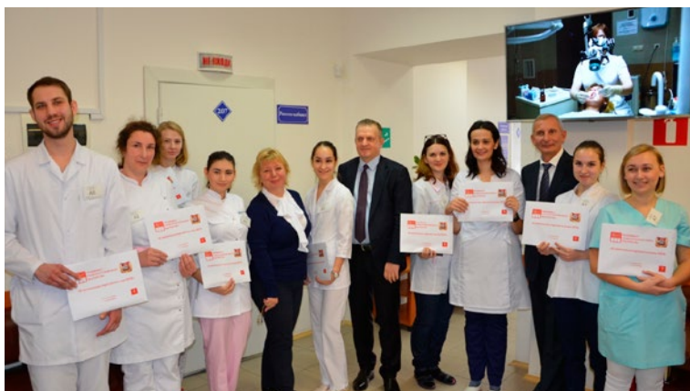
Начало Чемпионата стоматологического мастерства в номинации «Клиническая пародонтология», г. Екатеринбург, 03.12.2018 (получены конкурсные задания согласно жеребьевке)

общих и местных факторов в развитии заболеваний пародонта, местная противовоспалительная терапия при воспалительных заболеваниях пародонта, методы хирургического лечения заболеваний пародонта, антибиотикотерапия и применение бактериофагов в комплексном лечении пародонта, особенности клинического течения и лечения заболеваний пародонта