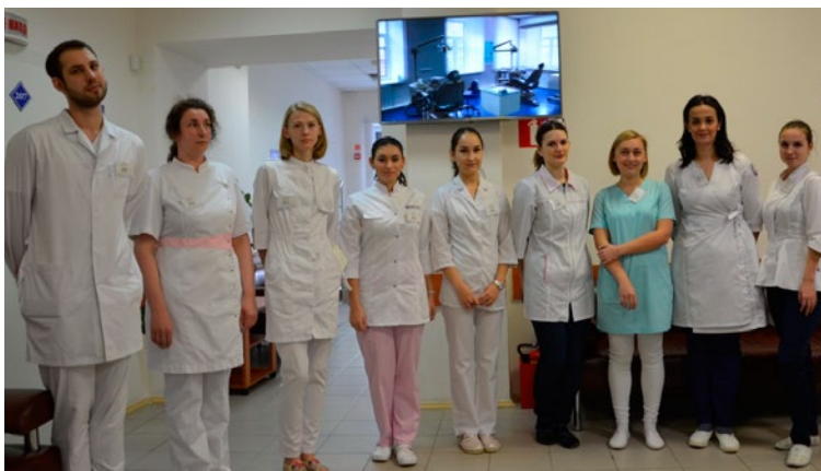
Участники очного этапа Чемпионата стоматологического мастерства в номинации «Клиническая пародонтология» в СП УГМУ, г. Екатеринбург, 03.12.2018