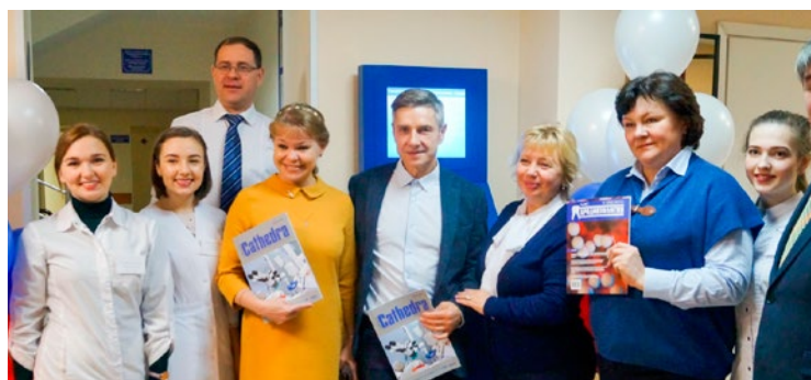
С лучшими студентами стоматологического факультета УГМУ